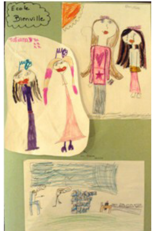
Dessins d'enfants réalisés après l'atelier

Personnes ayant une déficience intellectuelle : 123